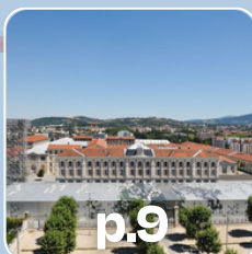
p.9 Saint-Etienne Métropole