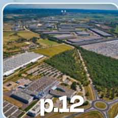
p.12 Parc Industriel de la Plaine de l'Ain