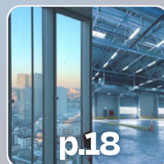
p.18 FNAIM Entreprises