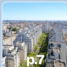
p.7 Société villeurbanaise d'urbanisme