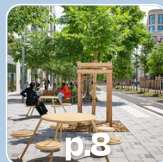
p.8 Groupe SERL