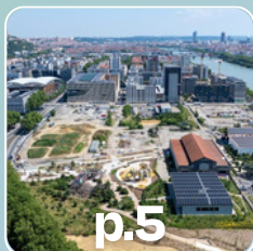
p.5 SPL Lyon Confluence