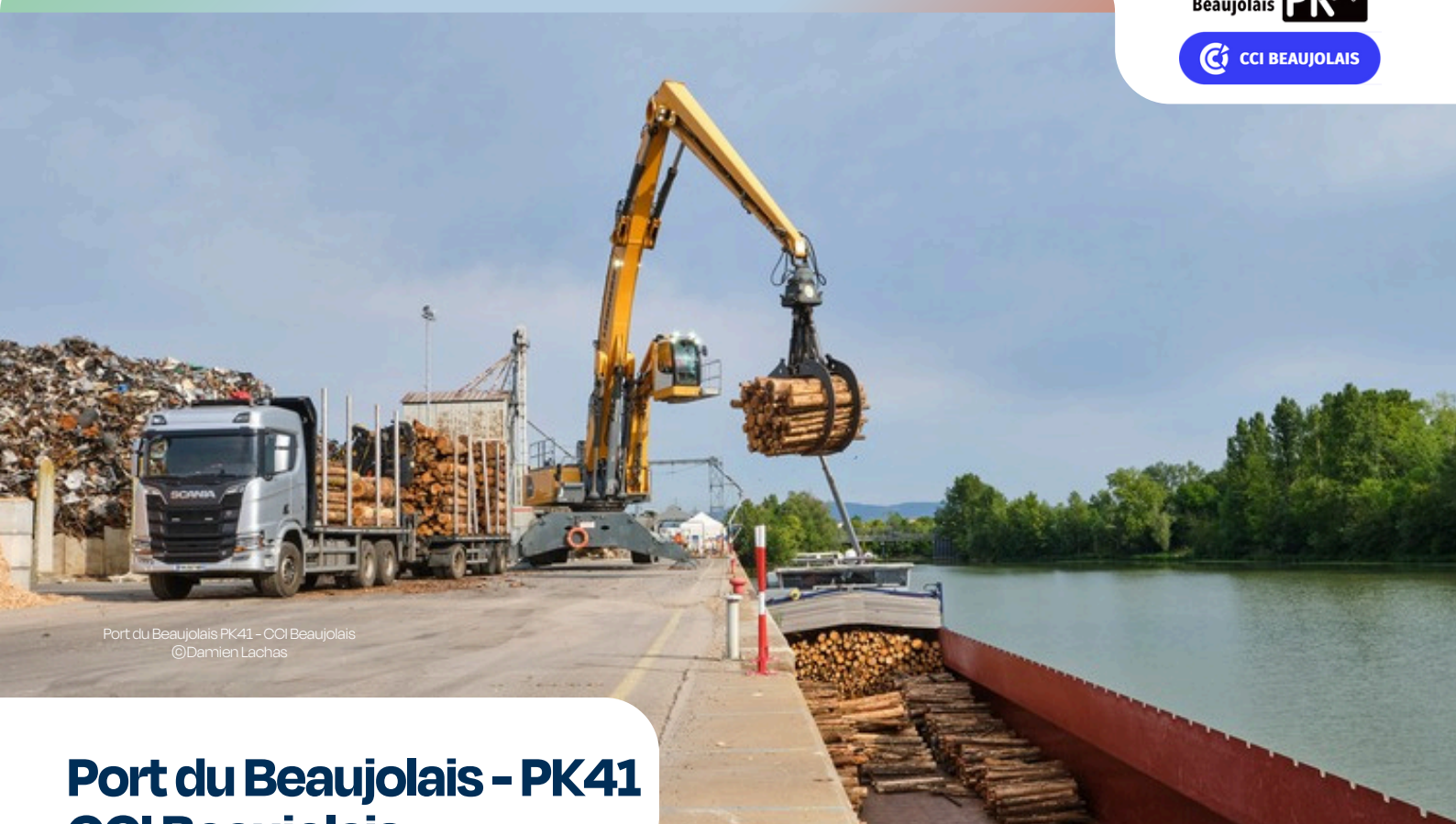
Port du Beaujolais PK41 - CCI Beaujolais