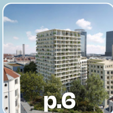
p.6 SPL Lyon Part-Dieu