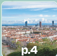
p.4 Métropole de Lyon