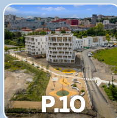
p.10 EPA Saint-Étienne