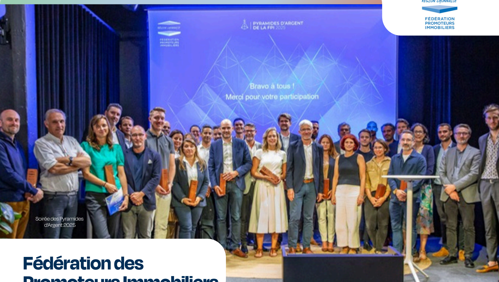
Soirée des Pyramides d'Argent 2025