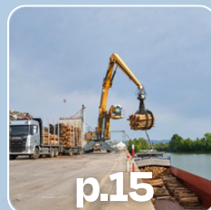
p.15 Port du Beaujolais CCI Beaujolais