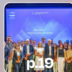
p.19 FPI Lyon