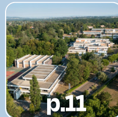
p.11 CCI Lyon Métropole Saint- Etienne Roanne