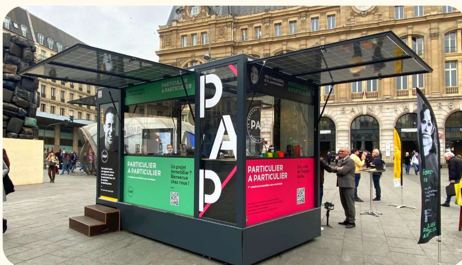
PICNIC taille L : 10 m 2