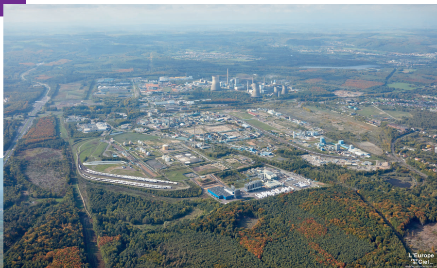
PLATEFORME CHEMESIS CARLING / SAINT-AVOLD