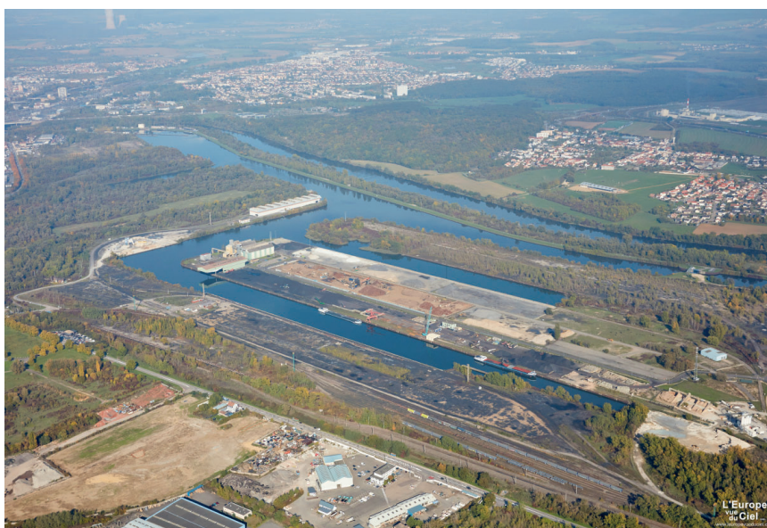
E LOG'IN 4 THONVILLE